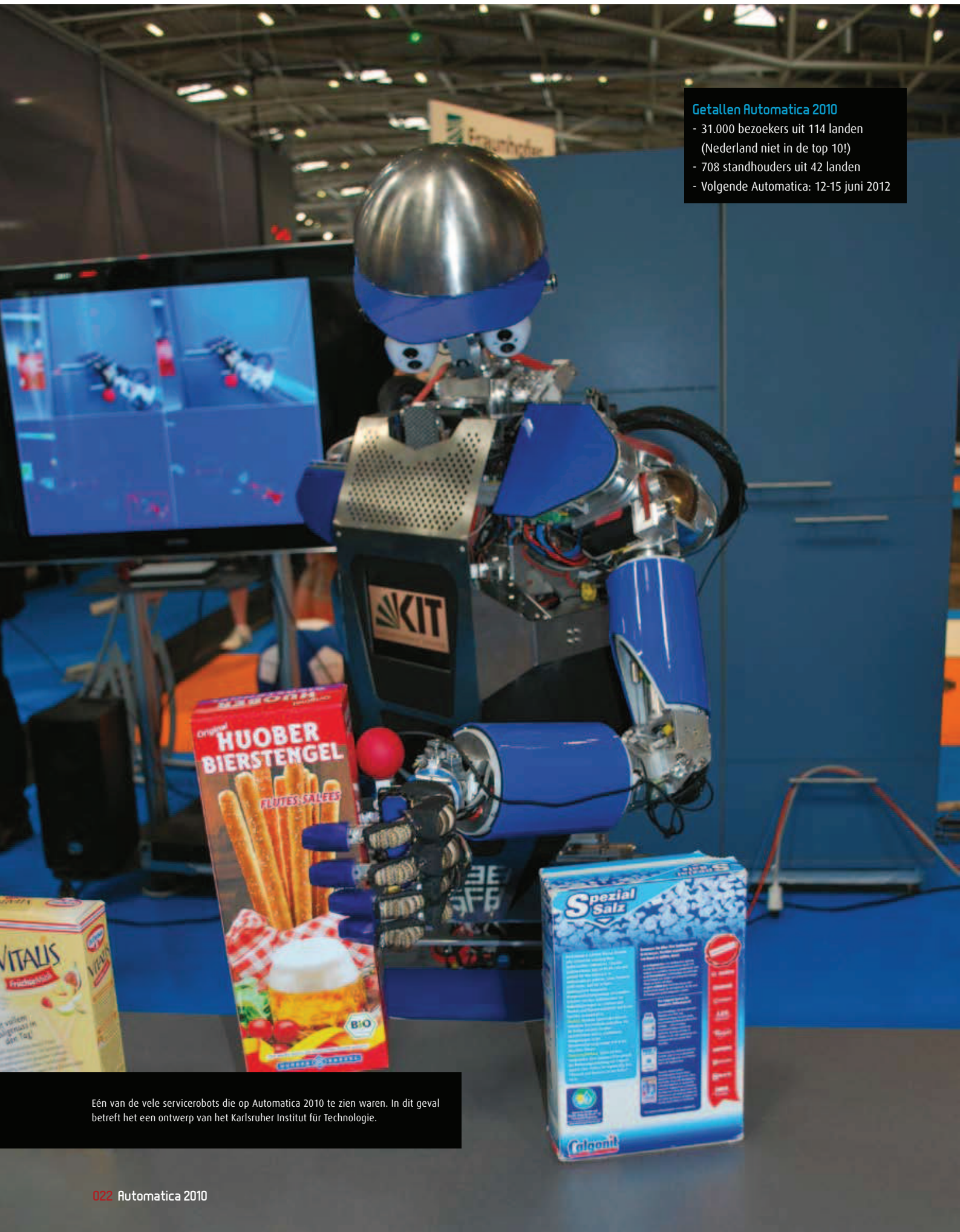
Eén van de vele servicerobots die op Automatica 2010 te zien waren. In dit geval betreft het een ontwerp van het Karlsruher Institut für Technologie.