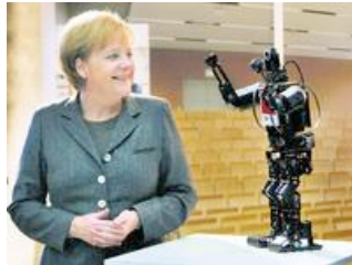
Gestatten, mein Name ist Bruno! Bundeskanzlerin Angela Merkel wird in Darmstadt von einem Fußball-Roboter begrüßt.

DARMSTADT (dpa) Mit Investitionen in die Forschung und dem Ausbau der Breitbandnetze will die deutsche IT-Branche die Wirtschaftskrise überstehen. Bundeskanzlerin Angela Merkel (CDU) versprach beim IT-Gipfel in Darmstadt, sich in der EU für den zügigen Ausbau des Breitbandnetzes für einen superschnellen Internet-Anschluss einzusetzen. "Ich habe auf europäischer Ebene vorgeschlagen, dass so wie China jetzt das Eisenbahn- und Straßennetz ausbaut, wir jetzt das Breitbandnetz ausbauen sollten", sagte Merkel. Ziel sei, dass Europa in drei bis vier Jahren sagen könne, jeder habe einen Breitbandanschluss.