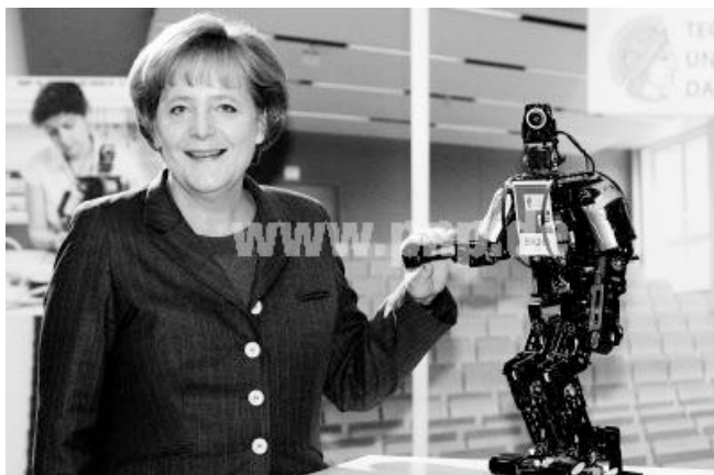
Offen für Innovation: Kanzlerin Angela Merkel nimmt beim IT-Gipfel Kontakt mit Roboter „Bruno“ auf.

IT-Gipfel: Bundeskanzlerin will Breitband-Ausbau in „drei bis vier Jahren“ - Der Branche fehlen 45 000 Fachkräfte