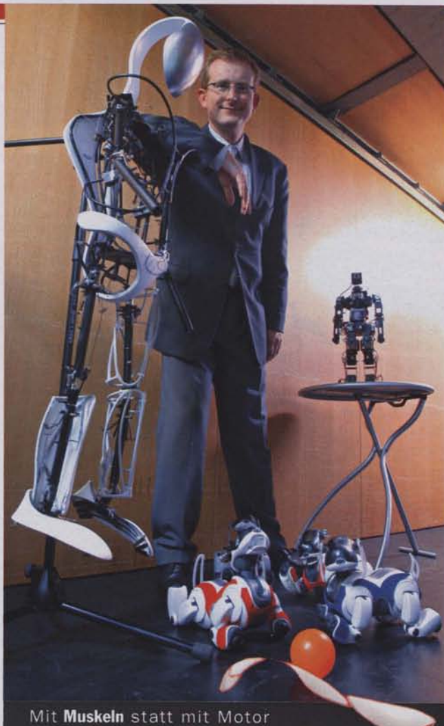
Mit Muskeln statt mit Motor